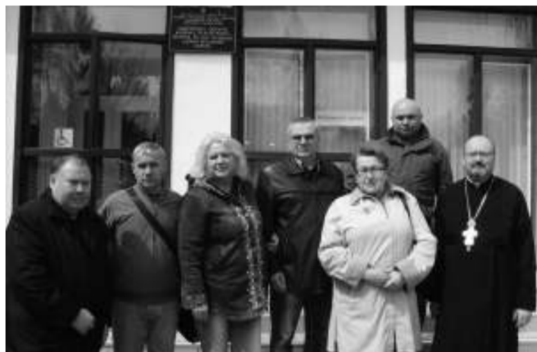
Група громадських активістів під час відвідин пацієнтів Полтавської обласної психіатричної лікарні.