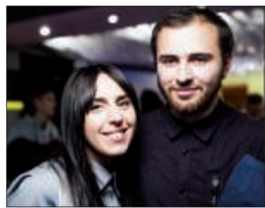
матичним складом розуму досягнути, що відбувається в музиці.

Переможниця Євробачення-2016 співачка Джамала повідомила, що готується до весілля зі своїм нареченим Бекиром Сулеймановим. І навіть заговорила про весілля в суку. Точніше, дві: традиційну та в кримськотатарському національному стилі. Весілля теж буде в змішаному стилі: у кримськотатарських та українських традиціях. Урочистості відбудуться в Києві, а в романтичну подорож молоді вирушать у Європу. Пара зустрічається півтора року. Наречений співачки - економіст і математик. За словами Джамали, він завжди підтримує її та допомагає своїм мате-